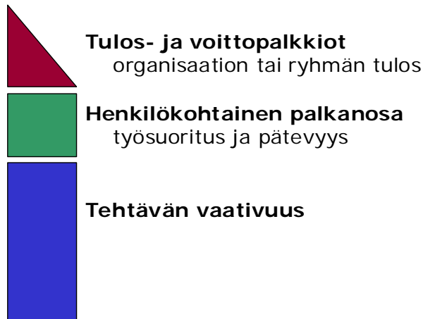
Kuva 1. Palkkausjärjestelmän osat (Työmarkkinajärjestöjen työnarviointijärjestelmien seurantaryhmä TASE 2003).

Työehtosopimus määrittelee samapalkkaisuusperiaatteelle rakentuvat palkkauksen vähimmäisehdot. Käytännön palkkatasoon vaikuttavat työehtosopimuksen määräysten lisäksi yrityskohtainen palkkapolitiikka, tehtäväkohtaiset markkinapalkat sekä toimiala ja työpaikan sijainti.