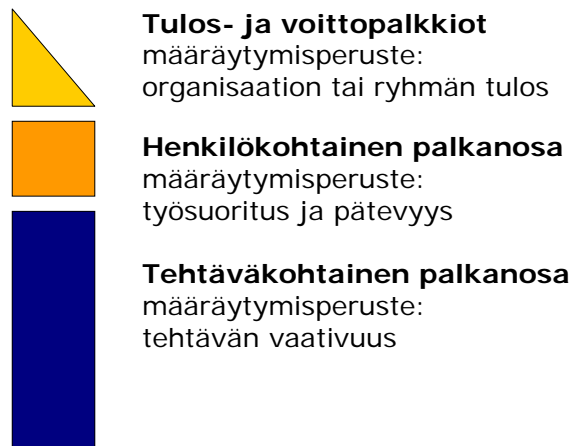
KUVA 1. Palkkausjärjestelmän osat (Työmarkkinajärjestöjen työnarviointijärjestelmien seurantarayhmä TASE 2003)

Pätevyyden ja työsuorituksen palkitseminen on yrityksen aktiivisen palkkapolitiikan tehtävä. Työehtosopimuksessa sovitussa palkkausjärjestelmässä on suositus henkilökohtaisen pätevyyden ja työsuorituksen arvioinnista.